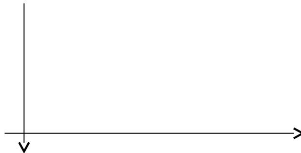
Рис.5. АЧХ фильтра НЧ