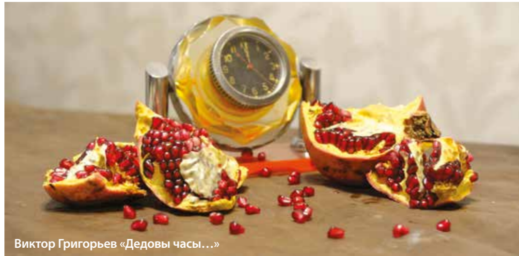
Виктор Григорьев «Дедовы часы...»

В экспозиции фотовыставки можно увидеть натюрморты, в основном это фотографии цветов; пейзажи, на многих из которых запечатлены узнаваемые байкальские просторы; городскую съемку родных улиц; представлено много анималистических кадров. Яркая и уникальная работа из таких – кормление дятлов. А среди натюрмортов можно найти многих заинтересовавшую фотоработу «Дедовы часы...», в центре изображения – танковые часы.